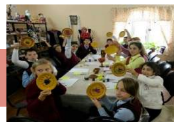
Мастер-класс по росписи тарелок

27 сентября 2018 года работники Передвижного Центра культуры и досуга г. Кимовска подготовили и провели для учащихся СОШ № 2 квест-игру «В русской горнице». Дети побывали на выставке, посвященной крестьянскому быту, где не только увидели старинные предметы, но и узнали их предназначение. Младшие школьники с удовольствием включились в игровую программу. Не только девочки, но и мальчишки ловко справлялись с ухватом, при помощи которого они ставили в русскую печь чугуны, гладили рубелем старинный рушник, смогли попробовать себя в умении прядения на прялке.