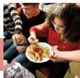
Яблоки с медом – символ праздника

Программа включала зажигательные еврейские танцы «Кан» («Здесь»), «Адама вэнашамаим» («Земля и небо»), песни «Шма, Исраэль!» («Слушай, Израиль!»), гимн еврейской общеобразовательной школы «Хаверим» («Друзья»), новогодний хит «Башана хабаа» («На будущий год»).