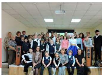
На память о празднике

Обмакивая яблоки в мед, все желали друг другу шана това умэтука («счастливого и сладкого Нового года»), благодарили за праздник.