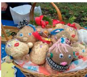
Игрушки из природных материалов