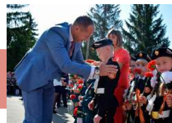
Посвящение в кадеты

Для малышей проводился конкурс рисунков на асфальте, работали любимые развлекательные аттракционы, катание на пони, палатки со сладостями, сувенирами и подарками. Народное гуляние в честь Дня Тульской области закончилось праздничным фейерверком.