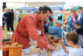
Мастер-класс «Бычок – смоляной бочок»

«Я на печке молотила», «Крутиха», «Прялочка» в исполнении лучших хореографических коллективов области, но и поучаствовать в танцевальных мастер-классах, поводить хороводы, весело отдохнуть.