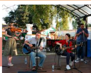
Песни для души

Кульминацией программы «В ажуре» стало карвинг-шоу бензопилой. Продемонстрировав виртуозное владение инструментом, мастер всего за три часа выполнил деревянную скульптуру гуся Добрыни. Сбросив стружки и опилки, талисман «Добродей» занял свое почетное место на ремесленном дворе. Праздник завершился выступлением ансамбля «Ласты Колумба».