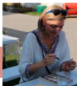
Украшаем обережную рамку

Ажурная тема объединила все площадки праздника. Программа включала экскурсии «Город деревянный», «Урок мастера», «История Тулы в лицах и наличниках», ярмарку-выставку и лавку изделий декоративно-прикладного и народного творчества, на которой были представлены деревянные игрушки и шкатулки, интересные украшения интерьера, работы по художественной ковке и гравировке; мастер-классы по тульской всечке и декорированию обережной рамки, награждение победителей областного литературного конкурса «Деревянная поэзия» и концерт. Украшением праздника стало дефиле-презентация белевского кружева «Кружевокружение».