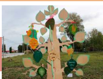
Дерево добрых дел

В рамках фестиваля юные экологи приняли участие в акциях «Поможем природе», «Сеем добро», «Природные игрушки – детям». Итогом добрых дел стали чистые газоны, подготовка рассады цветов, собственноручно изготовленные игрушки «Травянички», переданные в дар первоклассникам СОШ № 1 п. Теплое. Творческая площадка «Экологический аккорд» помогла выявить скрытые таланты и объединить более 130 участников экологического движения из разных уголков Тепло-Огаревского района в единую команду.