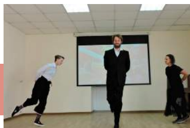
Еврейский танец «Кан»

Рош а-шана – это еврейский Новый год, древний праздник, который отмечается уже 5779-й раз. Зрители узнали, что в этот день был сотворен мир и первый человек Адам, увидели главные атрибуты Рош а-шана, попробовали традиционное новогоднее угощение – яблоки с медом.