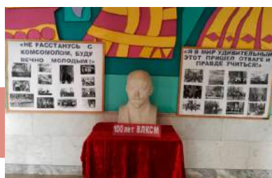
К 100-летию ВЛКСМ

Так называется фотовыставка к 100-летию ВЛКСМ, которая развернулась в фойе Киреевского РДК. Ее посетители познакомятся с основными вехами комсомольской жизни города и страны, ролью этой организации в воспитании молодежи.