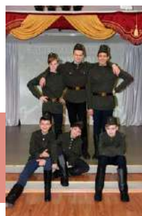
Артисты театра-студии «Арлекин»

День защитника Отечества никогда не устареет, и в этот праздник, по традиции, чествуют сильных духом мужчин, ветеранов войн, возлагают цветы к мемориалам, вспоминают героические страницы русской истории. Далее читайте, какие мероприятия состоялись в рамках этой даты в культурно-досуговых учреждениях Тульской области.