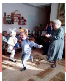
Творческий подарок к празднику

Твардовского «Василий Теркин», поучаствовали в соревнованиях по перетягиванию каната и сделали праздничную открытку.