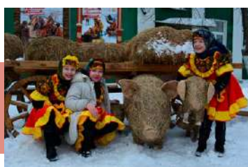
Участницы «Оникса» на «Добром подворье»

Популярностью пользовались интерактивные программы в музейно-выставочном комплексе «Тульский резной наличник». Дети и взрослые декорировали фоторамку, изготавливали обереги и участвовали в украшении резного скворечника.