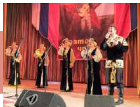
На сцене – ансамбль «Субботея»

Жюри предстояла нелегкая задача, настолько яркими, эмоциональными, необычными были концертные номера. Все участники показали высокий профессиональный уровень, интересный репертуар, раскрыли образы содержания песен.