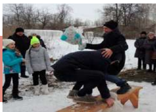
Бой на мешках

В д. Львово Кимовского района 17 февраля прошли масленичные гуляния, которые подготовили и провели работники автоклуба № 2 МКУК «ПЦКиД». Перед зрителями выступил народный фольклорный коллектив «Рябинушка», который исполнил фольклорные масленичные песни и частушки.