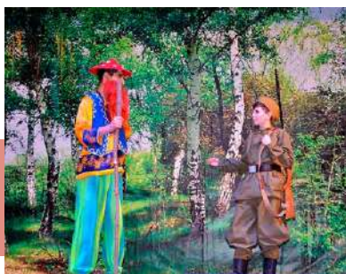
Встреча с лесовичком

В ефремовском РДК «Химик» состоялась премьера спектакля «Солдат Иван Тарабанов», подготовленного подростковым составом народного театра «Сувенир». По сюжету Иван Тарабанов едет на побывку домой. По дороге он встречает старичка-лесовичка, который рассказывает солдату, что к царской дочке повадился приходить бесенок, отчего царю нет спокойной жизни. Иван Тарабанов отправляется во дворец выручать царя.