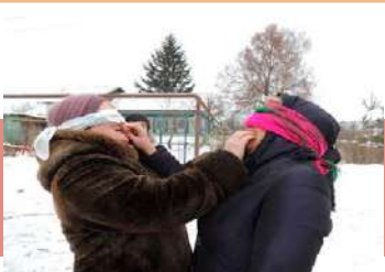
Конкурс «Накорми блином соседа»

В сквере «Центральный» кимовчане собрались на последний хоровод зимы. Программа праздника включала площадку «Масленичные забавы», выставку декоративно-прикладного творчества, концерт, дегустацию традиционных масленичных блюд. Все пели, плясали, играли, водили хороводы и лакомились блинами. Проводили зиму традиционным русским обрядом – сжиганием чучела Масленицы.