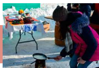
На площадке «Пенёк-блинопёк»

Масленица – один из самых древних и интересных праздников народного календаря. Это веселые проводы зимы, радостное ожидание близкого тепла и весеннего обновления природы. Длится Масленица неделю, каждый день которой имеет свое название, обычаи и ритуалы. Праздник отмечается красиво и с размахом, с особенным колоритом и щедрым угощением. Недаром говорится: «Как Масленицу встретишь – так и год проведешь!» Далее читайте, как отпраздновали проводы русской зимы на тульской земле.