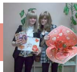
Такие разные валентинки

ник – самый сердечный день календаря, время для любовных признаний и добрых слов. Из разрозненных деталей зрители складывали одно большое сердце.