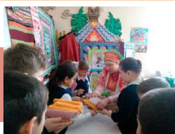
В творческой мастерской

С обрядами Масленицы начали знакомиться накануне праздника. Так, 8 февраля в Киреевском РДК прошла фольклорная познавательная программа для младших школьников «Масленичные обрядовые печенья». Дети узнали о традициях, приняли участие в забавах и конкурсах.