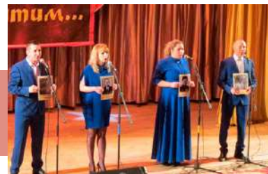
Поют солисты «Гремячанки»

По итогам подсчета баллов определились победители в разных номинациях. Обладателем Гран-при конкурса стало вокальное трио «Господа-товарищи» (пос. Ленинский). Их выступление запомнилось зрителю проникновенным исполнением песни «Ясный сокол» и торжественным пожеланием «Многая лета русской земле». Среди вокальных ансамблей лауреатом I степени признан народный ансамбль народной песни «Субботея» (пос. Иншинский) с хитами «Златая Русь» и «Русь называют святою», лауреатом II степени стал вокальный ансамбль «Россиянка» (ТУМГ п. Пришня), исполнивший песни «За тихой рекою» и «Бывший подьесаул», лауреатом III степени – вокальная эстрадная группа «Летний вечер» (г. Новомосковск), представившая на суд жюри сложную композицию «Если бы перекрестила ты меня во след» и агитационную песню нового времени «Вперед, Россия!».