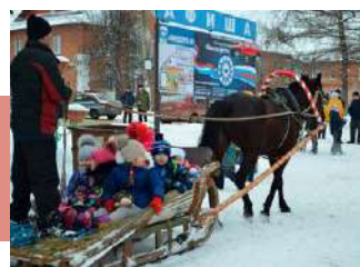
Катание на санях

Массовое гуляние прошло и в Плавске. Его подготовили работники МБУ «Городской дом культуры», краеведческого музея, образовательные учреждения города. Праздник порадовал всех плавчан не только традиционными выставками, угощениями и катанием на лошади, но и театрализованной концертной программой, которую показали воспитанники детско-юношеской театральной студии «Галатей». В этот день зрители узнали о традициях масленичной недели, а также посмотрели короткую сказку о пришествии на планету Земля весны-красавицы. Дети и взрослые соревновались в скоростной распилке дров, метании валенка, боях на бревне и стрельбе из лука.