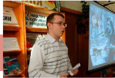
Звучат стихи В.С. Высоцкого

В читальном зале межпоселенческой центральной районной библиотеки г. Кимовска прошел юбилейный вечер «Голос правды и добра». Много было сказано о поэте, перипетиях его нелегкой судьбы, всенародной любви. Зрители посмотрели кадры из фильмов и спектаклей с участием Высоцкого, послушали стихи и песни в авторском исполнении, откровения его друзей и современников.