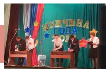
Мастера на все руки

Они представили себя и свою профессию в визитной карточке «Я рад знакомству с вами», проявили смекалку и находчивость в блиц-опросе по военной тематике, презентовали исторический костюм богатырей, изготовленный со своей группой поддержки, поразили умением справляться с домашними делами (пришивали пуговицу, вкручивали саморез, мастерили поделку из детского конструктора), блеснули актерским мастерством в конкурсе пародий на звезд эстрады и шоу-бизнеса. В зале не смолкали аплодисменты болельщиков.