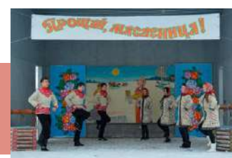
Концерт в парке ДК «Гипсовый»